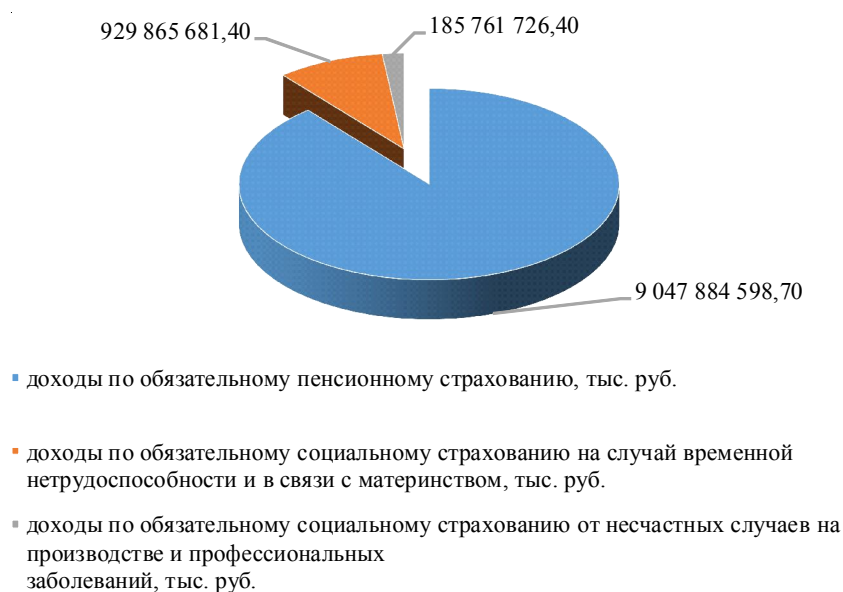
Рис. 2. Доходы Фонда пенсионного и социального страхования в 2023 году

Примечание. Составлено по: [Федеральный закон № 467-ФЗ, 2022].