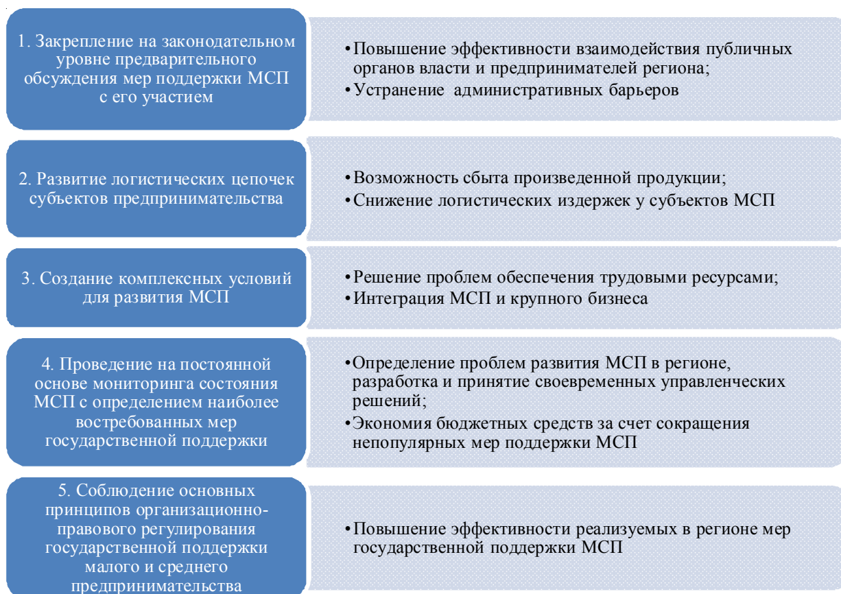
Рис. 3. Перечень мер, направленных на создание условий для развития малого и среднего предпринимательства в условиях санкций в Волгоградской области