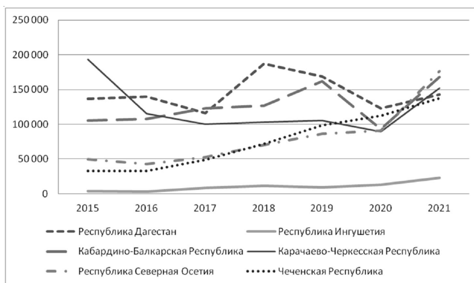
Рис. 2. Динамика загрузки КСР в СКФО

Примечание. Составлено по: [Основные показатели социальной сферы ... , 2018–2021].