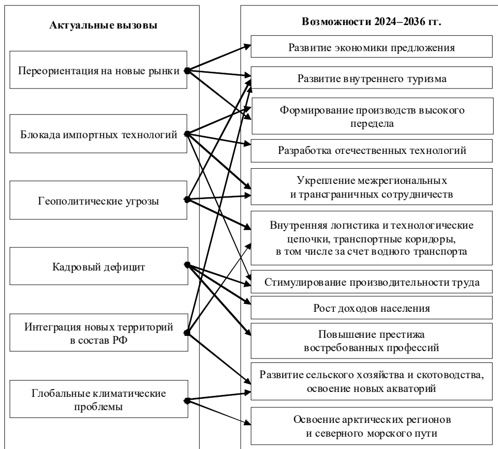
Рис. 1. Система «новые вызовы – новые возможности»

Применение интегральных методик весьма популярно как в экономической науке в целом, так и для оценки регионального развития. Контент-анализ результатов запросов через поисковую систему eLibrary.Ru дает перечень из более чем 800 источников по запросу «интегральная методика оценки регионов» при выборке с 2019 г. по всем видам публикаций. Соответственно, можно сделать вывод об универсальности и доступности применения такого математического ме-