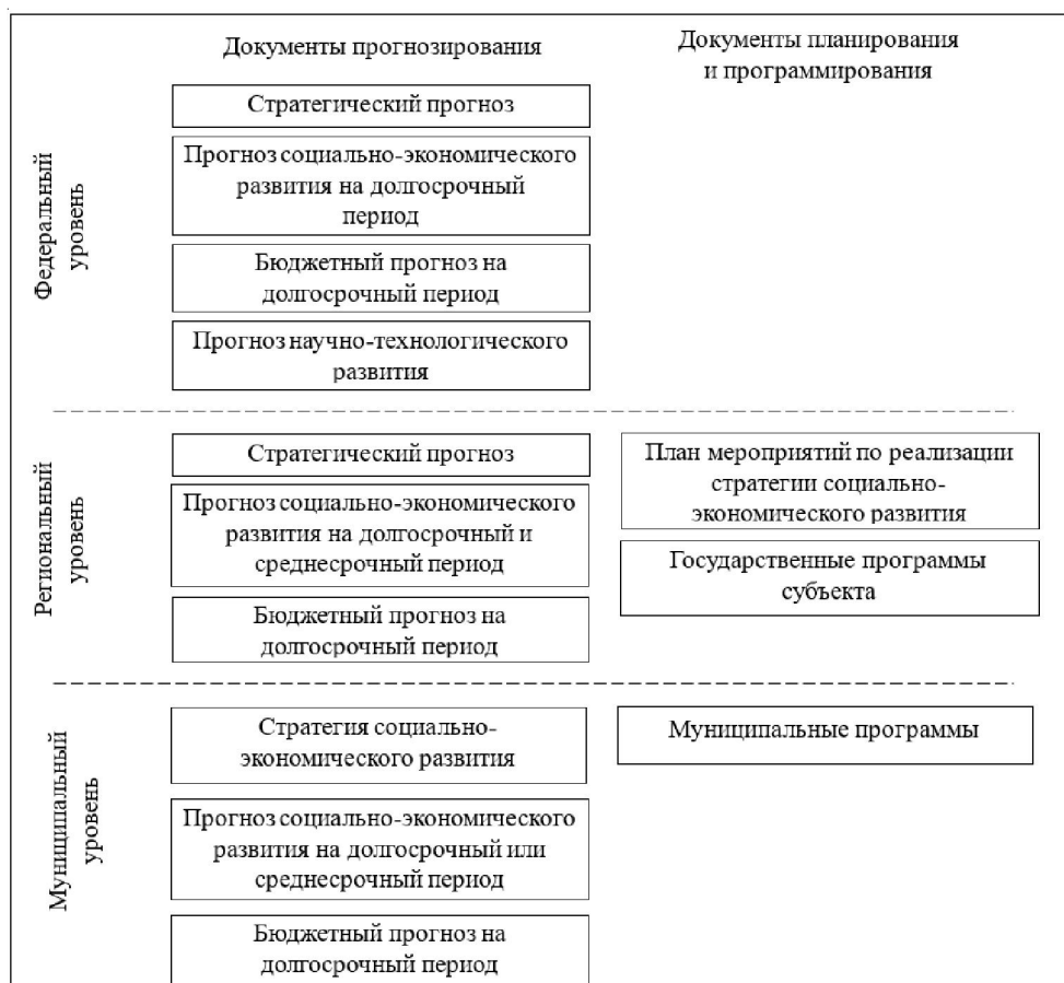
Рис. 1. Схема основных документов, устанавливающих положения стратегического планирования

Примечание. Составлено автором по: [Об общих принципах ... , 2014].