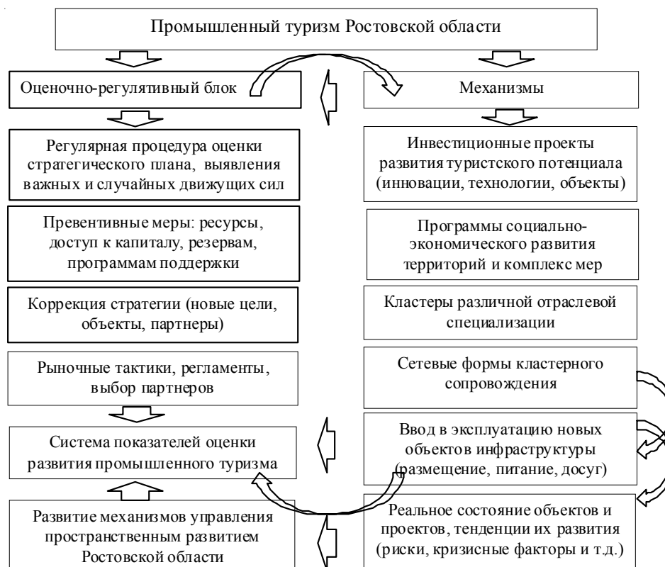
Рис. 3. Механизм развития промышленного туризма Ростовской области на проектно-кластерной основе

В то же время программа продвижения данного направления услуг должна разрабатываться в соответствии с потребностями и желаниями предприятий, которые будут использоваться в качестве объекта туризма.