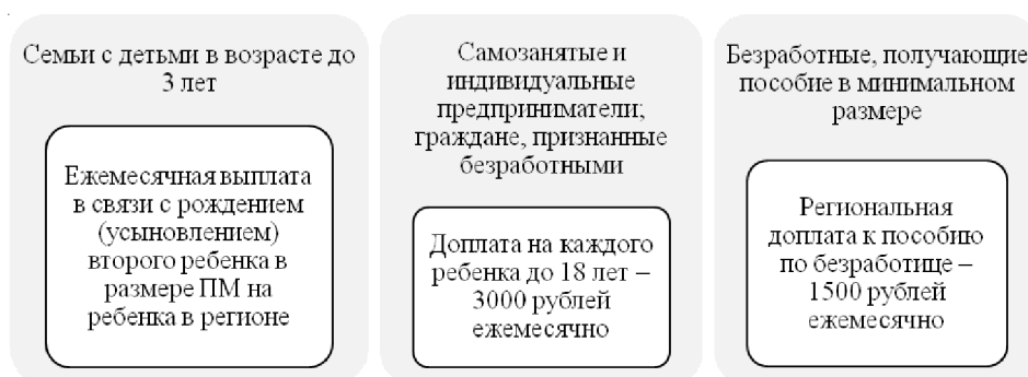
Рис. 2. Меры социальной поддержки нуждающихся категорий граждан в Волгоградской области

На рисунке 3 представлена типовая организационная структура Центра социальной защиты населения Волгоградской области до и после