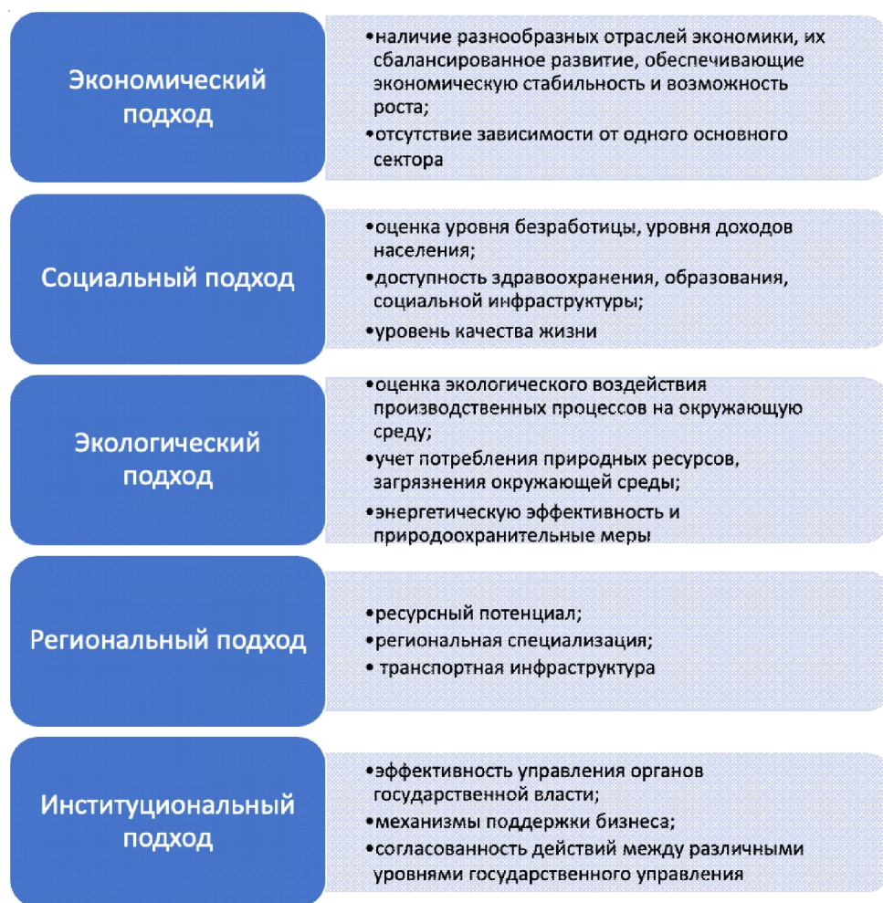
Рис. 2. Комплексные подходы к сбалансированному и устойчивому развитию региона