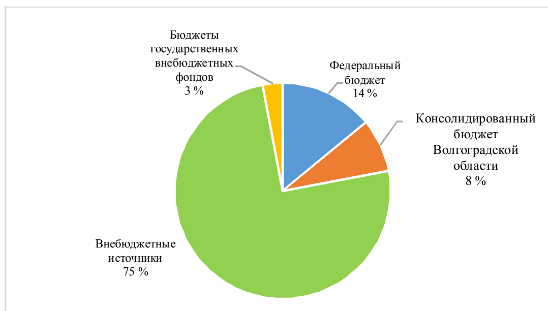
Рис. 2. Распределение источников финансирования на реализацию Стратегии-2030 при базовом сценарии развития

Примечание. Составлено по: [Автоматизированная система ... , 2022].