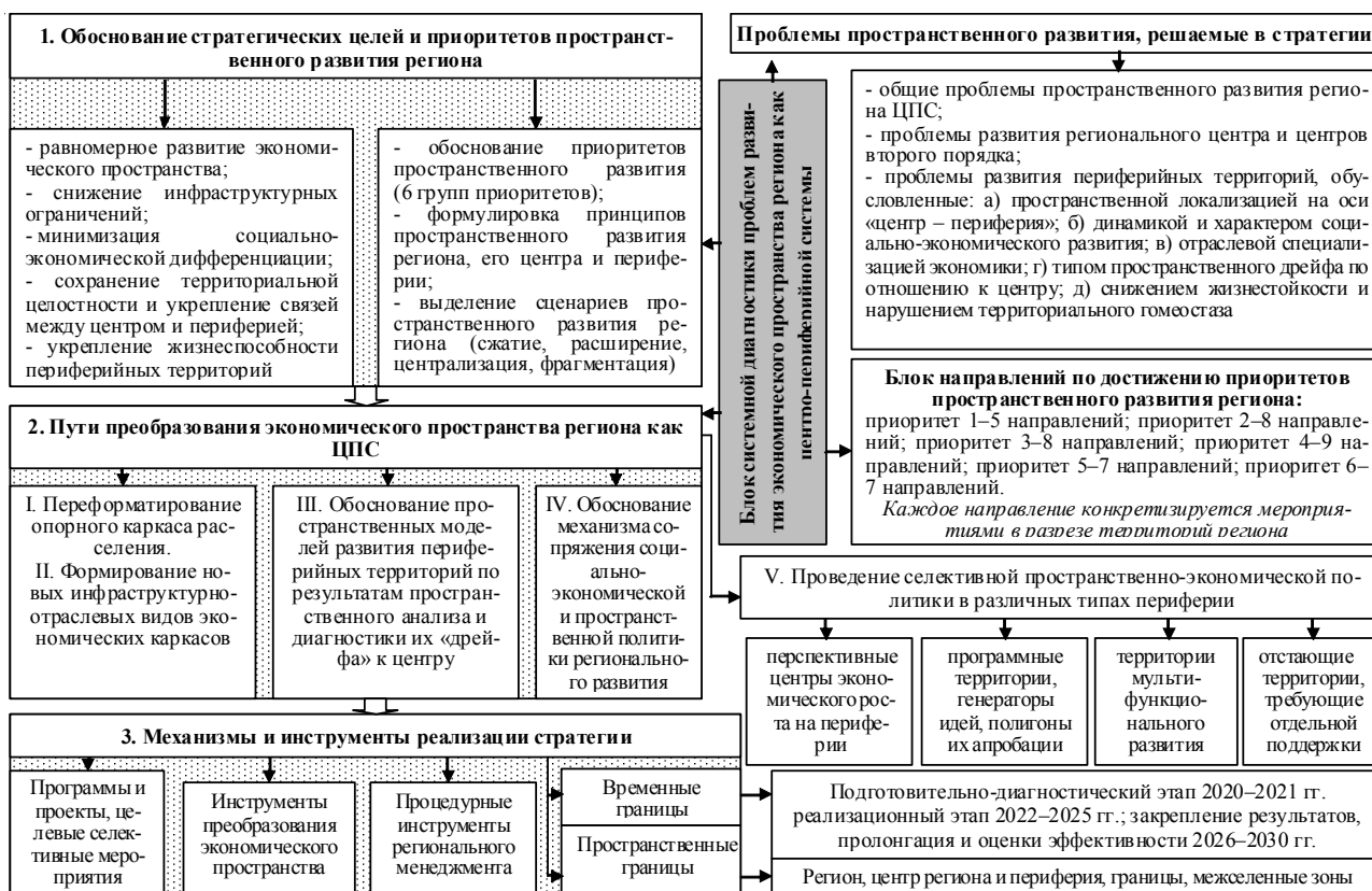
Рис. 3. Ключевые компоненты стратегии пространственного развития региона

The publication was carried out in the framework of implementing the State Task of the Southern Scientific Centre of the Russian Academy of Sciences, project state registration no. АААА-А19-11901190184-2.