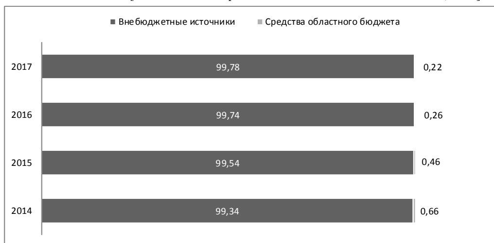
Рис. 2. Структура источников финансирования подпрограммы «Развитие МСП в Ростовской области» в 2014–2017 гг., %

Примечание. Составлено по: [Постановление Правительства Ростовской области № 599, 2018].