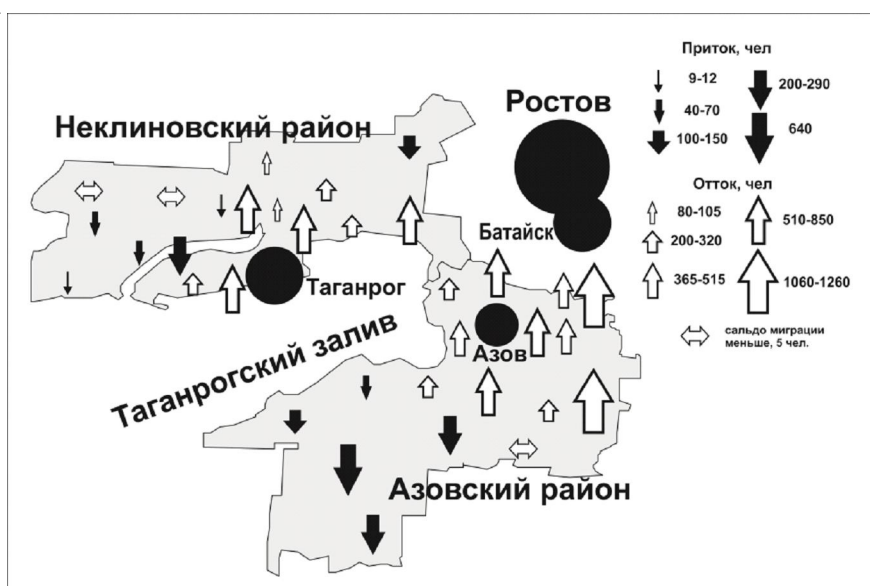
Рис. 3. Суммарное сальдо миграции в сельских поселениях приморских районов Ростовской области, 2011–2017 гг., чел.

Примечание. Составлено по: [База данных показателей муниципальных образований, 2019 (Ростовская область)].