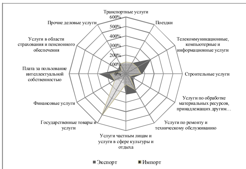
Рис. 3. Темпы роста внешней торговли услугами Республики Беларусь в 2018 г. по сравнению с 2012 г.

Примечание. Собственная разработка на основе данных Национального статистического комитета Республики Беларусь.